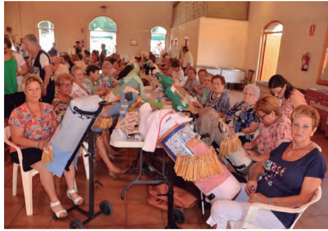
Desenes de puntaires van prendre part a la Trobada organitzada pel Grup de Dones de Riudecanyes a l'Eura.