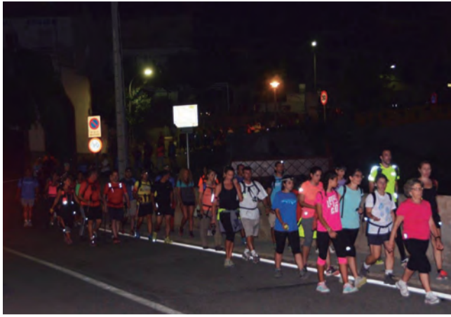
Al setembre vam sortir de nit, a la Caminada Nocturna de l'Associació Esportiva Baronia d'Escornabou.