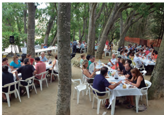
Les tradicions s'han de mantenir el Dinar que organitzen els Joves del Centre Cultural de Riudecanyes és una d'elles.