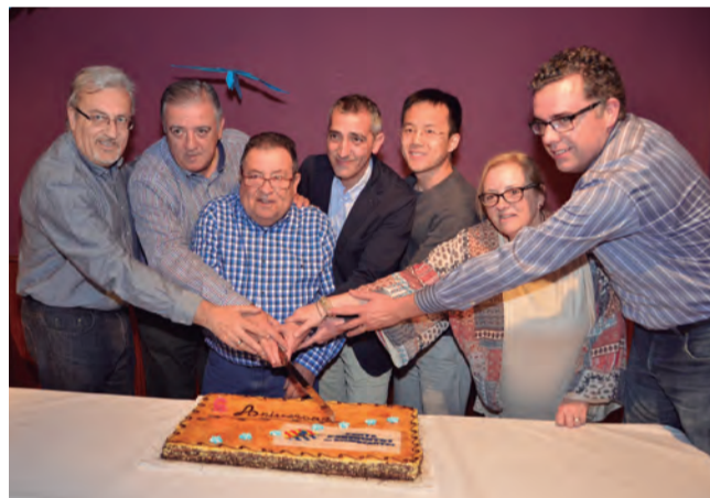
La Peña Periquitos de Riudecanyes va celebrar el passat 12 de març el seu sisè aniversari.