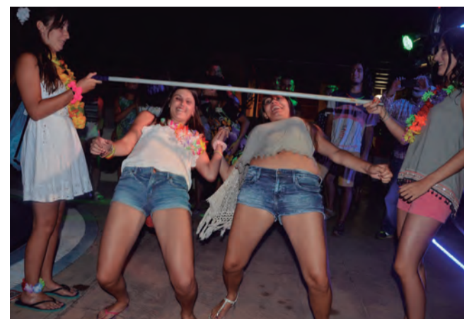
El Joves van complir amb les expectatives i el passat 5 d'agost ens va preparar una Festa Hawaiana de primera.