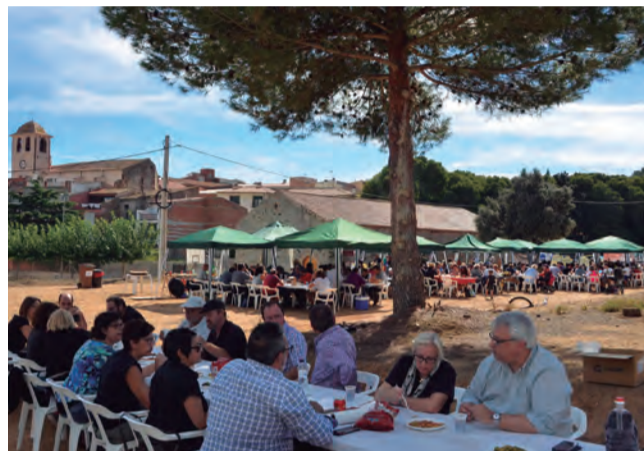
El concurs de paelles organitzat per l'AMPA de l'escola Sant Mateu va ser tot un èxit de participació.