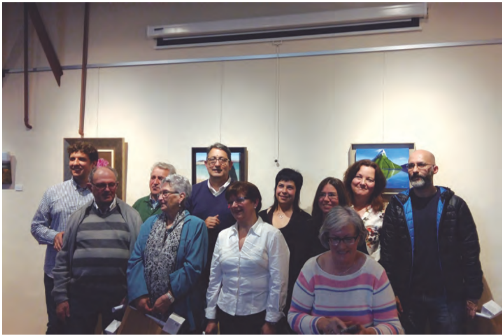
Vilanova d'Escornalbou va acollir la segona exposició col·lectiva dels artistes de la Baronia el passat mes de maig.

Les entitats de Riudecanyes juguen un paper molt important en el dia a dia del municipi organitzant moltes activitats. Durant tot l'any es mantenen vives i fan possible una vida social més activa. Aquestes imatges que ara veureu són l'exemple clar d'aquesta constant interacció entre les associacions i els qui les gaudeixen. Gràcies a totes elles per la seva tasca. ■