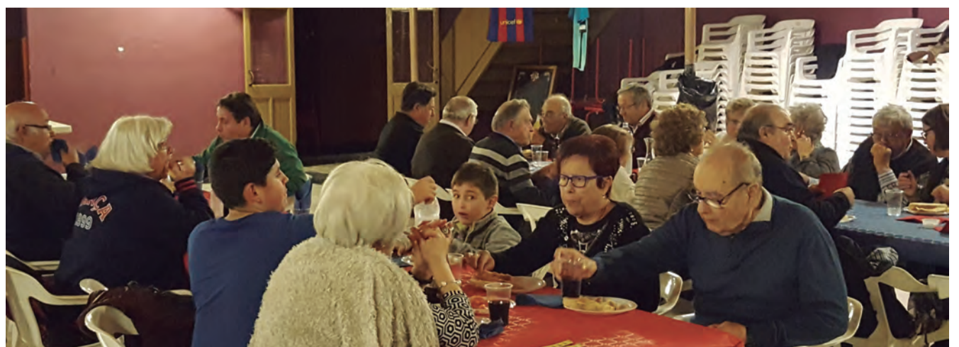
Com cada any, l'assemblea de la Peña Barcelonista de Riudecanyes va reunir a desenes de socis i acompanyants en una jornada ben rodona.