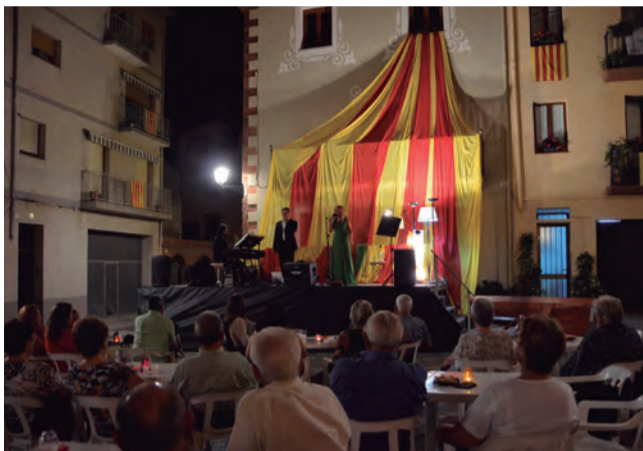
Els actes institucionals de la Diada de l'Onze de Setembre van comptar amb una bona assistència de públic.