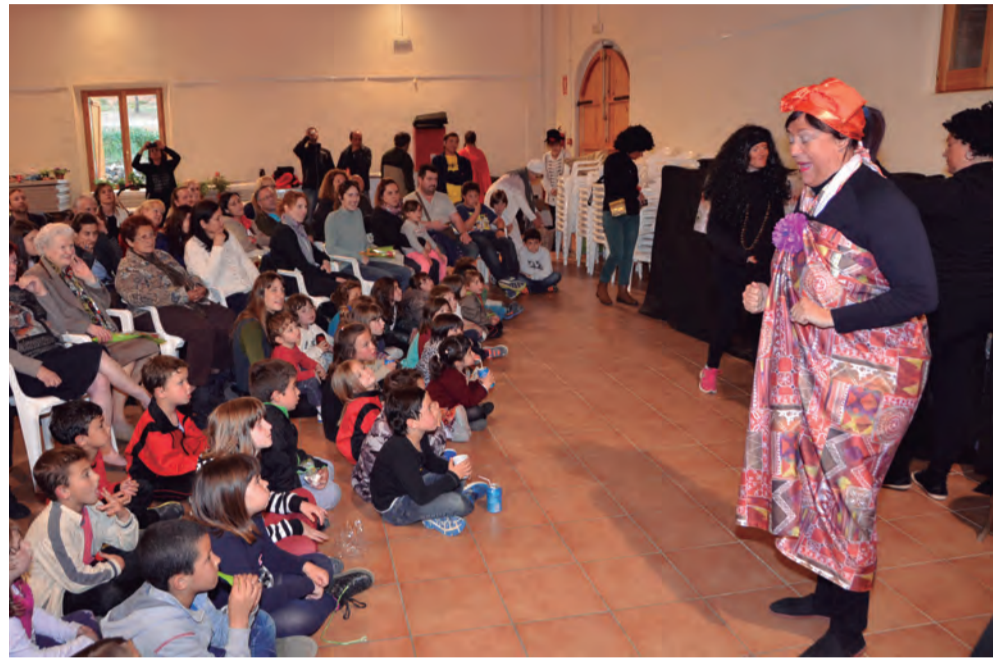
Sant Jordi va estar ple d'activitats entre els més petits amb les activitats organitzades per l'AMPA.