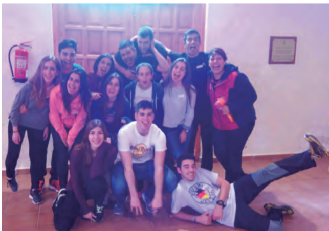
Una quinzena de joves del Centre Cultural van gaudir del taller de Risoteràpia que es va celebrar a l'Eura.