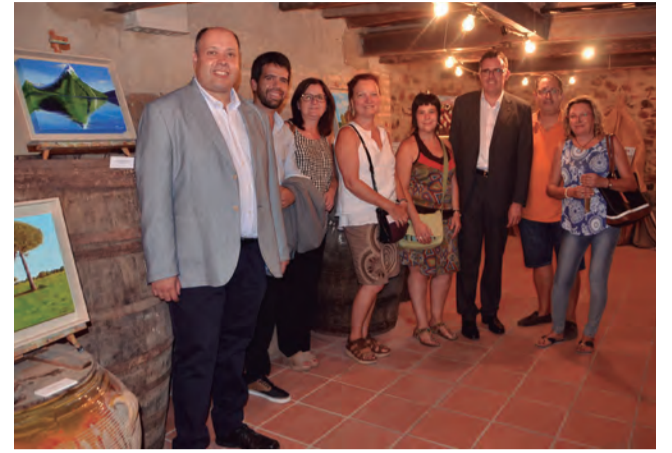
El primer cap de setmana de setembre, els artistes de la Baronia d'Escornabou van exposar al Montbriart.