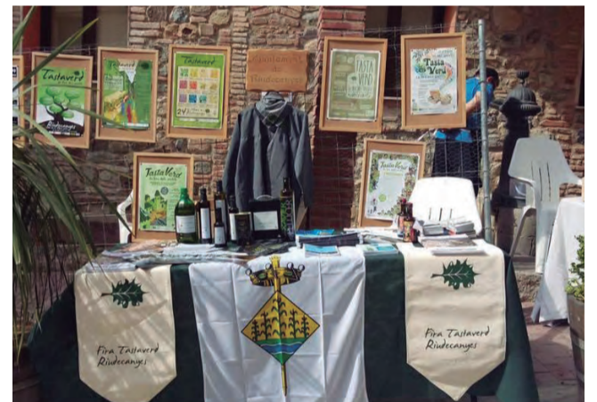
Els dies 21 i 22 de maig vam ser presents a la Fira Muntanyum que es va celebrar al municipi veí de Duesaiçües.