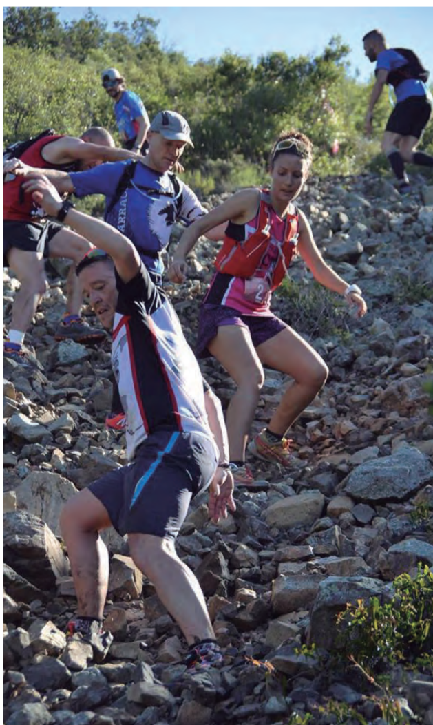
Al juny va néixer la primera edició de la cursa Els Cims del Baró organitzada per l'A.E Baronia d'Escornalbou.