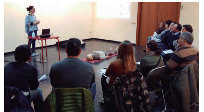
Enguany hem fet cursos per aprendre a fer funcionars els desfibril·ladors que hi ha instal·lats a diferents espais del nostre municipi. Els trobareu a la Plaça de la Vila, a l'Eura, al Consultori Mèdic i al Centre d'Interpretació de l'Oli (aquest, a l'estiu el traslladem fins a la piscina).